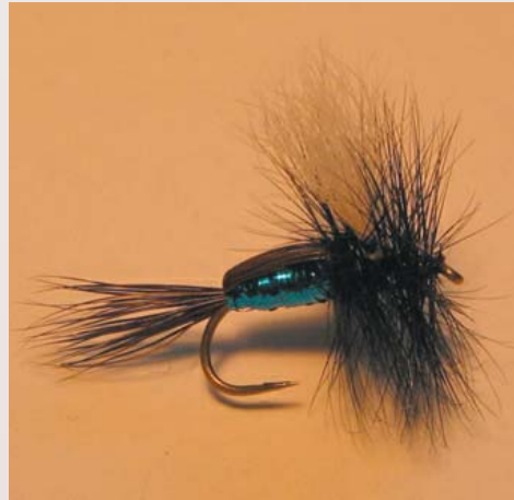
Oben: Eine Blow Fly. – Rechts: Ein „rig“.