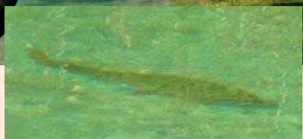
Oben: Die Wiesenbach-Partie. · Mitte: Glasklar. Schöner Schatten. · Unten: Die Wildbach-Partie.