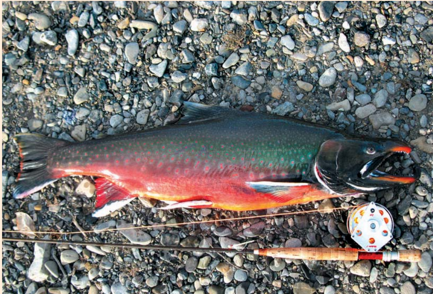
Foto: Kapitaler Arctic Char aus dem Kelly River.