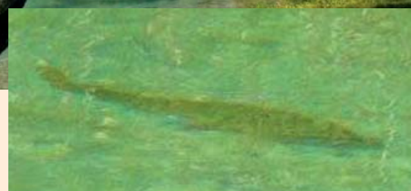
Oben: Die Wiesenbach-Partie. · Mitte: Glasklar. Schöner Schatten. · Unten: Die Wildbach-Partie.