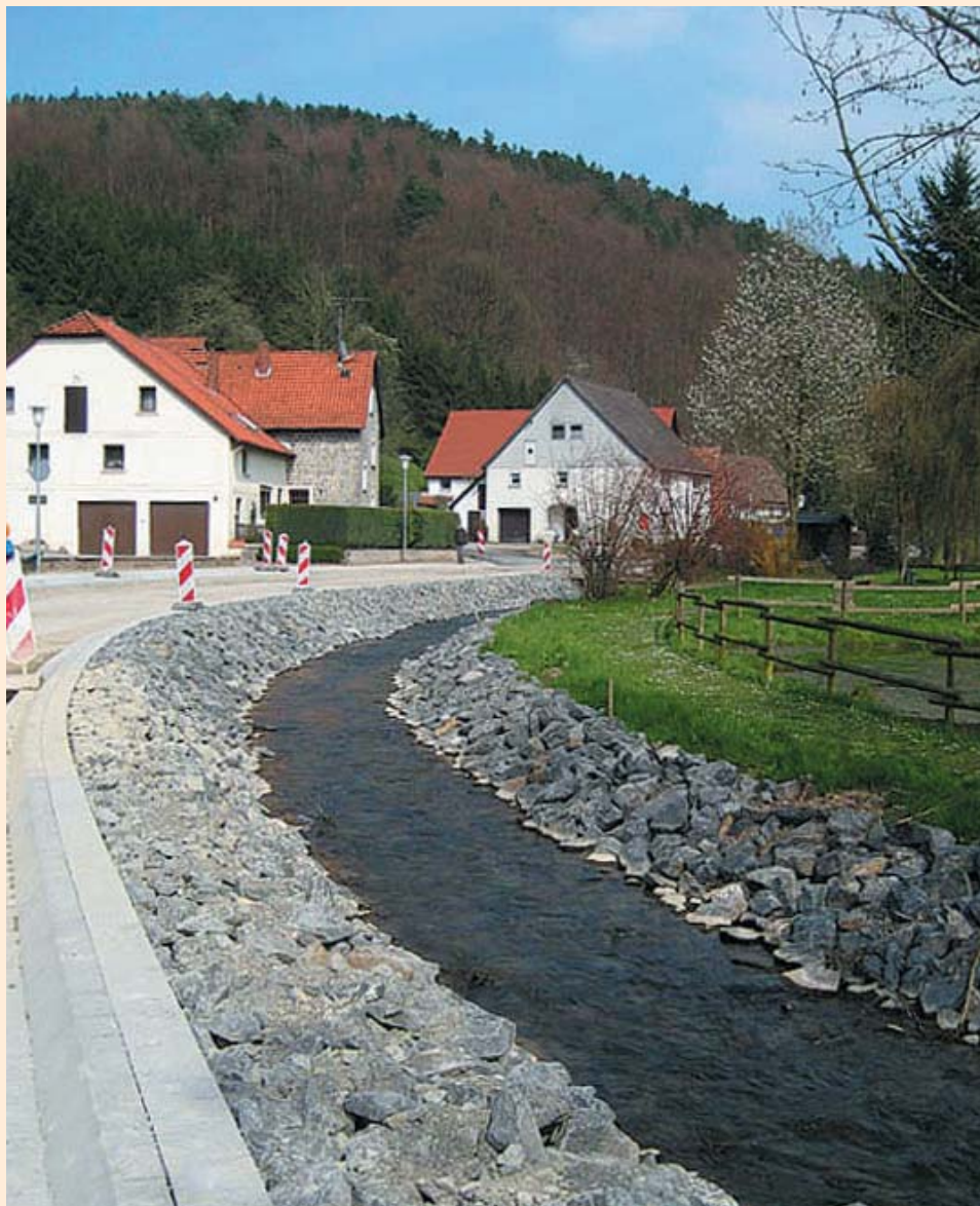
Die Osterkalle in Tevenhausen – eine wasserbauliche Schandtat im 21. Jahrhundert.

Eine Antwort auf diesen Brief steht nun schon seit bald einem Jahr aus ... Red.